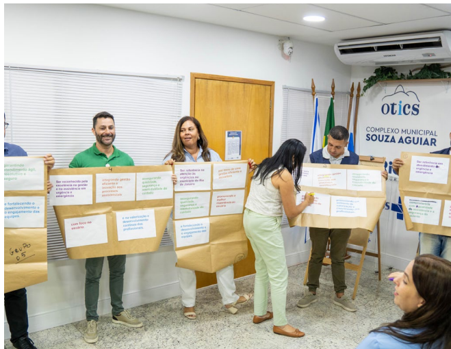
A "Visão" das UPAs foi construída de forma coletiva

Gestores das unidades avançam na elaboração do seu Plano Estratégico 2025-2028