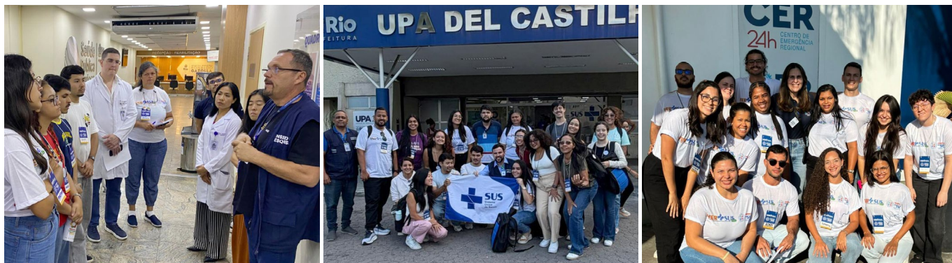
Os alunos do Projeto VER-SUS conheceram a saúde pública do município em visitas ao Gazolla, UPA Del Castilho e CER Barra

Gazolla, UPA Del Castilho e CER Barra recebem jovens do Projeto VER-SUS para imersão na prática em saúde