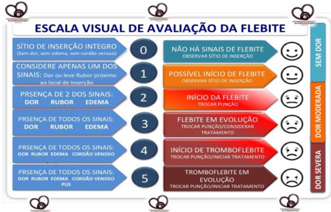
Figura 5. Escala Maddox.