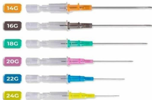
Figura 2. Tamanhos de cateter sobre agulha.