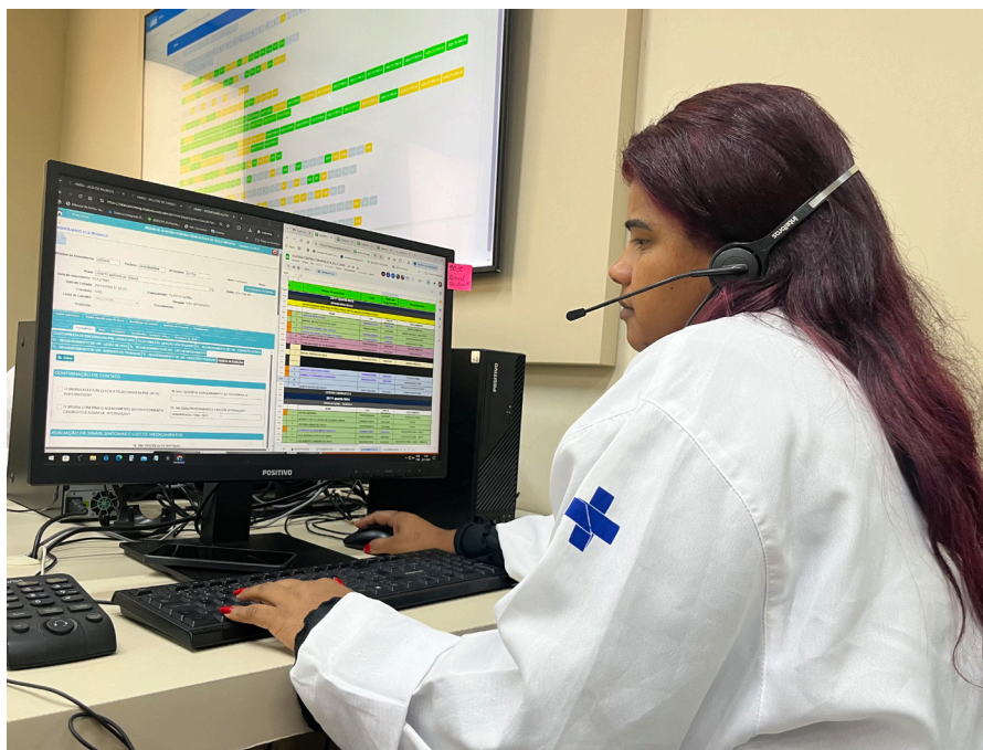
O novo serviço melhorou os indicadores de processos e resultados do centro cirúrgico